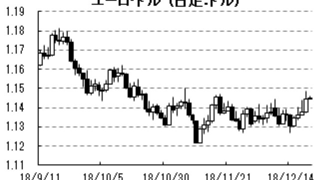
ユーロドル (日足:ドル)